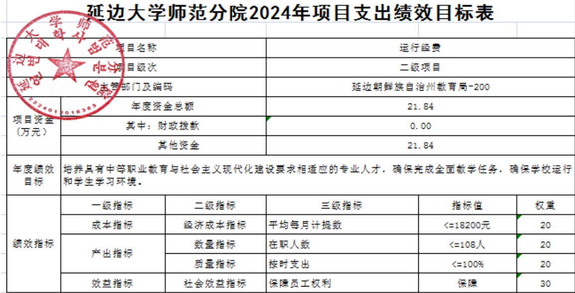
延边大学师范分院2024年项目支出绩效目标表