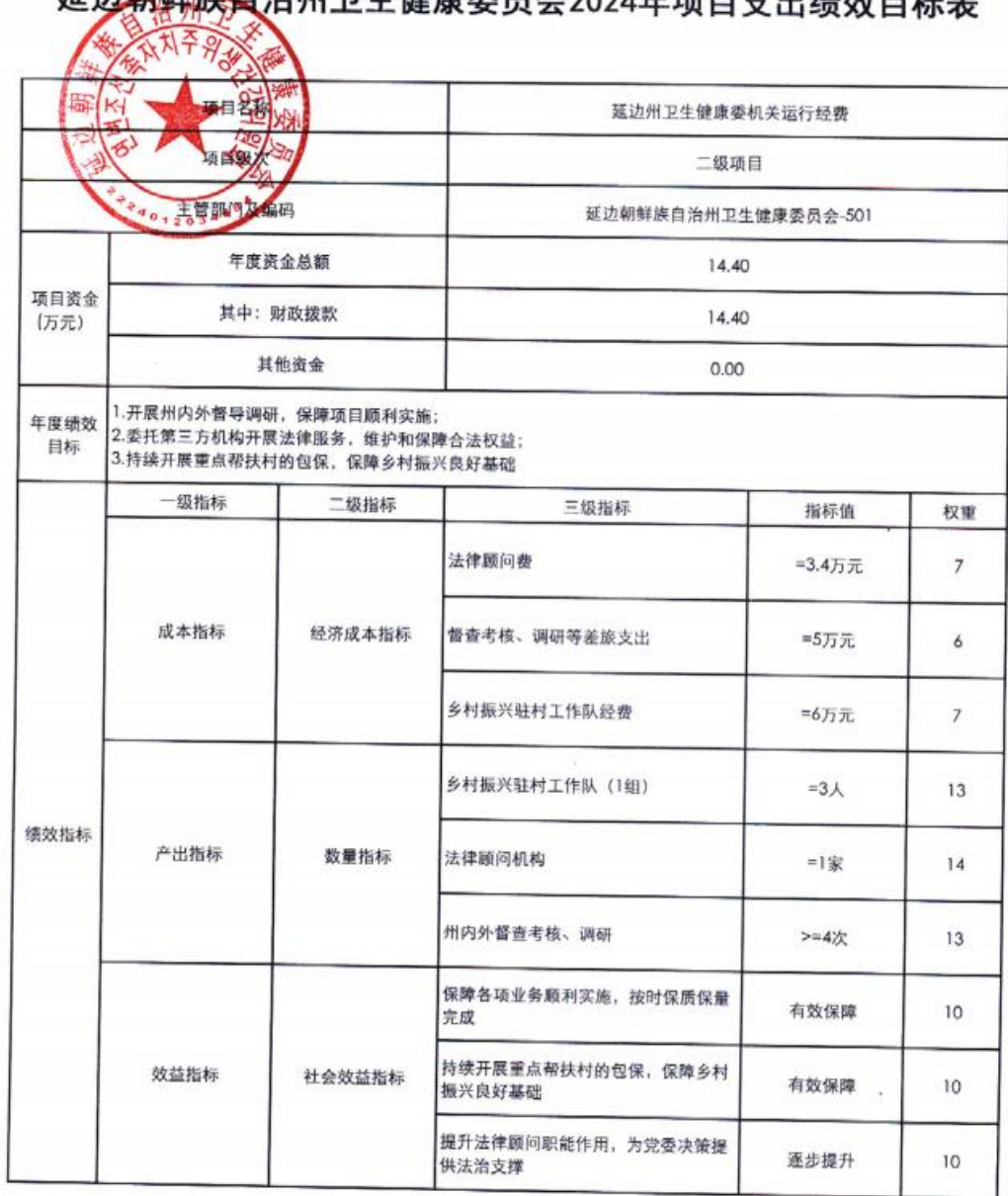
延边朝鲜族自治州卫生健康委员会2024年项目支出绩效目标表