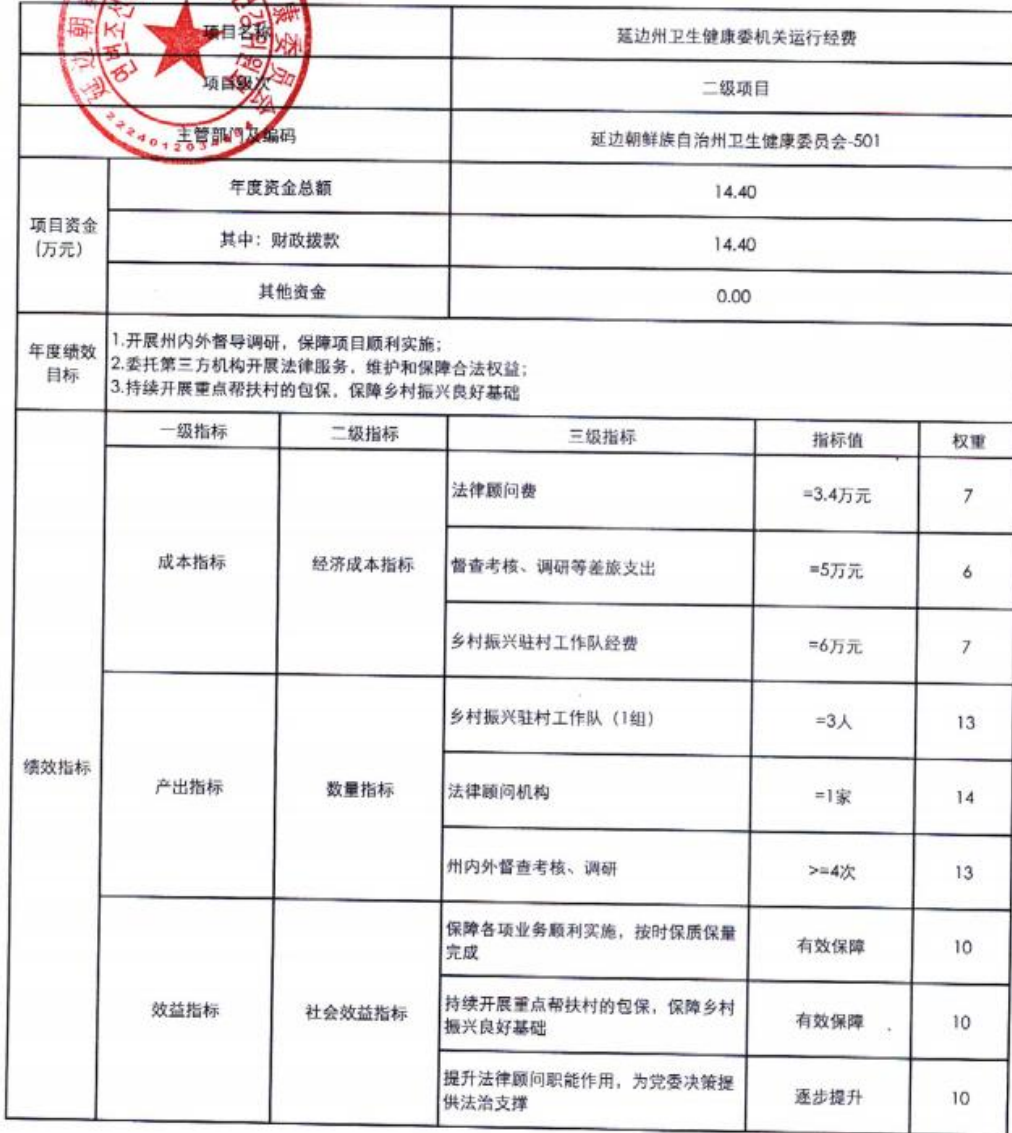
延边朝鲜族自治州卫生健康委员会2024年项目支出绩效目标表