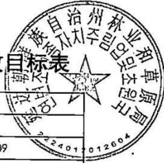
延边朝鲜族自治州林业和草原局2024年项目支出绩效目标表