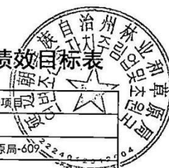
延边朝鲜族自治州林业和草原局2024年项目支出绩效目标表