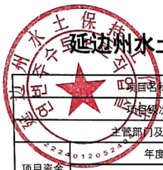
延边州水土保持工作站2024年项目支出绩效目标表