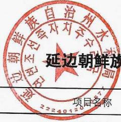
延边朝鲜族自治州水利局2024年项目支出绩效目标表