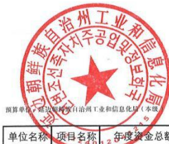
延边朝鲜族自治州工业和信息化局项目支出绩效目标表