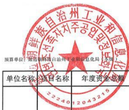
延边朝鲜族自治州工业和信息化局项目支出绩效目标表