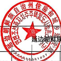
延边朝鲜族自治州住房和城乡建设局（汇总）项目支出绩效目标表