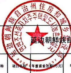
延辺朝鮮族自治州住房和城乡建设局（汇总）项目支出绩效目标表